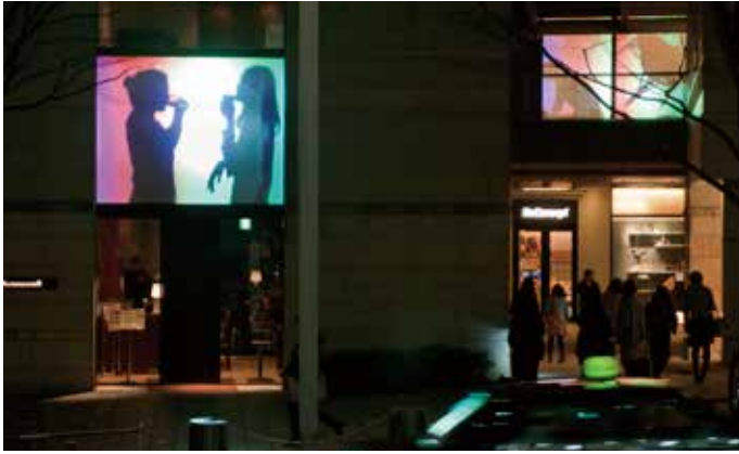
by the Window 六本木アートナイトバージョン 2012