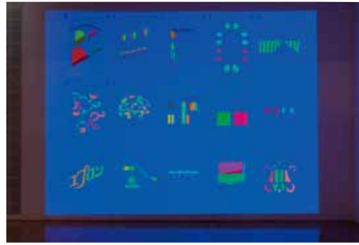
Blue Moment 府中市美術館バージョン 2014