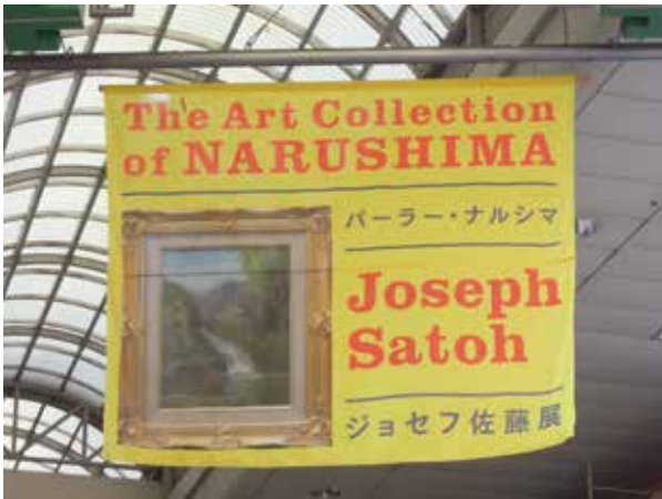
BGA Project アートラインかしわ 2012